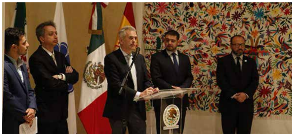
La participación de México en Teherán ha generado un gran interés.

objetos mexicanos, además de una muestra del libro infantil y juvenil en el Pabellón de México, con la participación de la Secretaría de Cultura federal, ProMéxico, Agencia Mexicana de Cooperación Internacional para el Desarrollo y la Cámara Nacional de la Industria Editorial Mexicana.