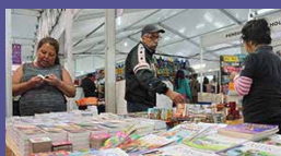
Feria Nacional del Libro Zacatecas del 25 de mayo al 3 de junio