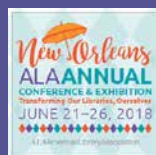
ALA (Nueva Orleans, EU) del 21 al 26 de junio