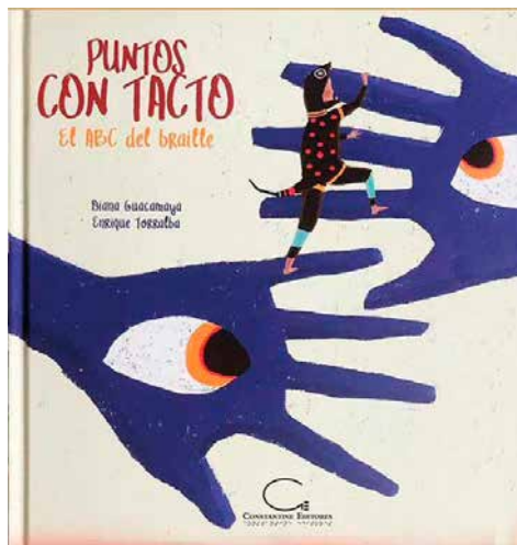
"Puntos con tacto. El ABC del braille", obra editada por Constantine Editores

“Pero ése no es total de la población joven ciega y con baja visión en el país porque hay chicos que viven en lugares lejos de las ciudades, entonces no hay un censo real, muchos no asisten a la escuela porque no existen materiales para ellos”, comenta Constantine.