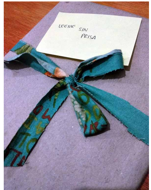
"Cita a ciegas con un libro", instalación ganadora, es una invitación a la lectura y la diversión.