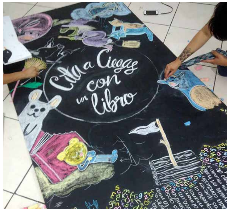
Un gran trabajo el que realizaron los ganadores.

La tercera edición de este certamen se llevó a cabo en 2014, año en el que participaron 43 librerías, más del doble que en la edición anterior, y 20 estados distintos. En 2015, el Concurso tuvo una participación de 32 librerías provenientes de 16 estados distintos. Para 2016, se contó con una participación de 23 librerías, provenientes de 11 estados distintos; 7 de ellas de la Ciudad de México y 4 de Chihuahua. Para 2017, se nombró “Concurso de Exhibición de Libros Infantiles y Juveniles” teniendo una participación de 43 librerías provenientes de 20 estados de la República Mexicana.