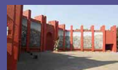
Primera Feria del Libro Cuernavaca 2018 del 1 al 10 de junio de 2018