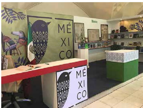
Pabellón de México en la XXXI FIL de Teherán.