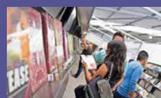
Feria del Libro de Ciudad Juárez del 26 de mayo al 3 de junio