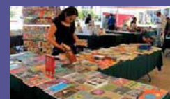
FIL Arteaga, Coahuila del 8 al 17 de septiembre